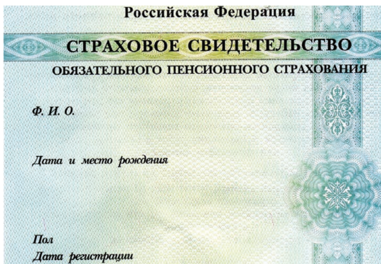
Рис. 59. Свидетельство пенсионного страхования

В России действует система обязательного пенсионного страхования (ОПС). Любой работающий человек обязан делать взносы в эту систему в течение своего страхового стажа. Если он работает по найму, эти взносы за него делает работодатель. Чтобы в будущем получать пенсию, вы обязательно должны быть зарегистрированы в системе ОПС. Для этого надо обратиться в территориальный орган Пенсионного фонда Российской Федерации. Он откроет вам индивидуальный лицевой счёт и выдаст страховое свидетельство обязательного пенсионного страхования . Свидетельство представляет собой пластиковую карточку (рис. 59).